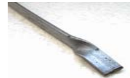
Windeisen zum Auflöten vorbereitet.

Runde Windeisen werden mit Bleihaften befestigt.