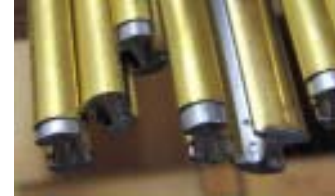
Messing- und Neusilber überzogene Sprossen werden durch Lötten verbunden.

Diese Sprossen bestehen aus einem Bleikern, der mit dem entsprechenden Blech überzogen ist. Messing z.B. erhält mit der Zeit eine schöne Patina - es kann natürlich jederzeit mit feiner Stahlwolle wieder auf Hochglanz poliert werden. Bei Alugold ist Nachpolieren nicht möglich !